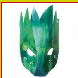
con la plastica