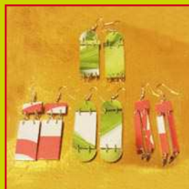
con la carta plastificata