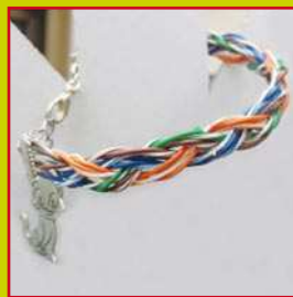
con i fili metallici