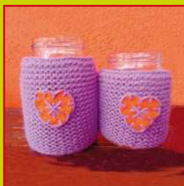
con il vetro