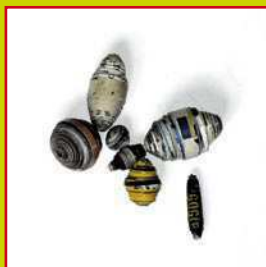
con ritagli di giornale