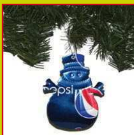
con le Lattine