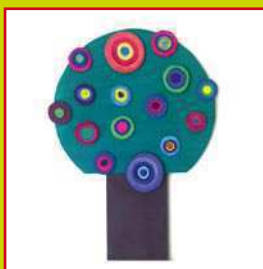
con il cartone