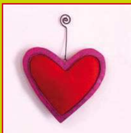
con la carta pesta